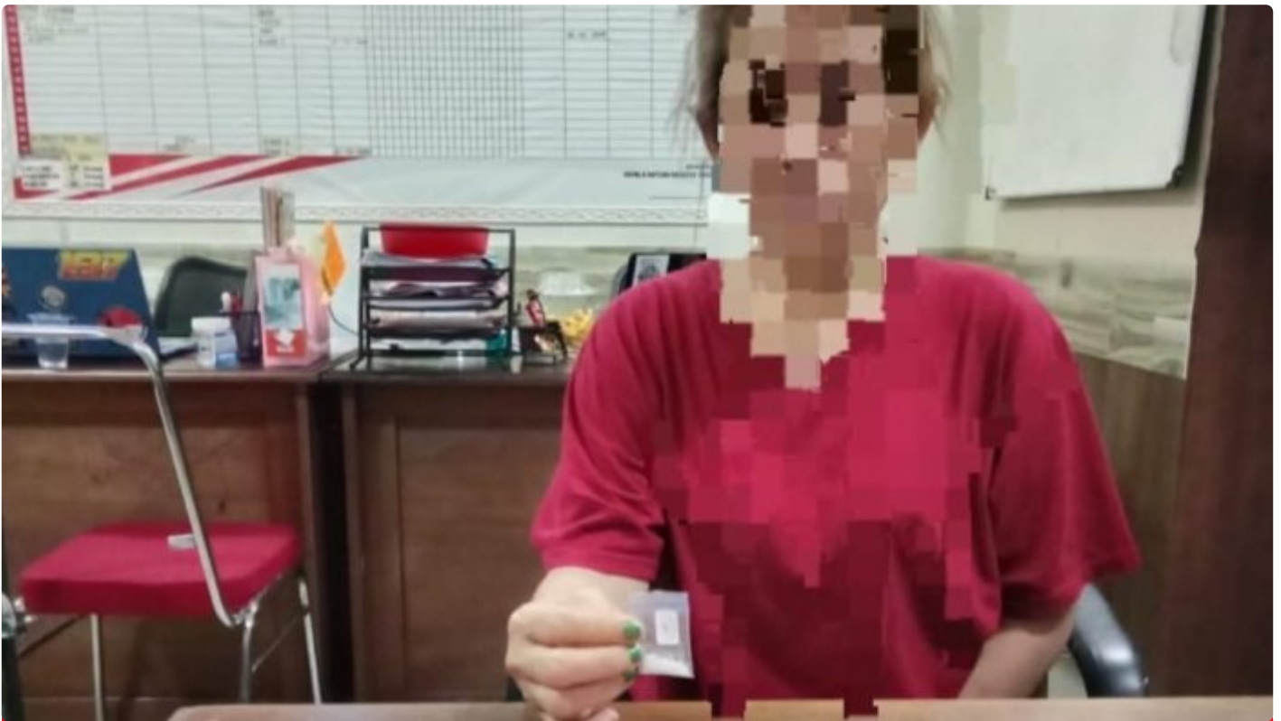
Tampak Salah Satu Tsk Perempuan beserta Babuk Sabu

MOROWALI, Sulawesi Tengah- Satuan Reserse Narkoba (Sat Resnarkoba) Polres Morowali berhasil mengungkap kasus penyalahgunaan narkotika jenis sabu di wilayah hukum Polres Morowali, Provinsi Sulawesi Tengah, di awal tahun 2024 yakni pada hari Rabu, tanggal 3 Januari 2024, sekitar pukul 17.30 Wita.